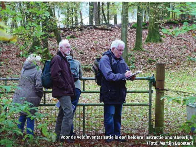
Voor de veldinventarisatie is een heldere instructie onontbeerlijk.