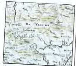
Het Engelandersholt (Engelerholt) in de 17e eeuw op de kaart 'Geldria Ducatus et Zutphania Comitatus' (Willem Janszoon Blaeu, 1635)