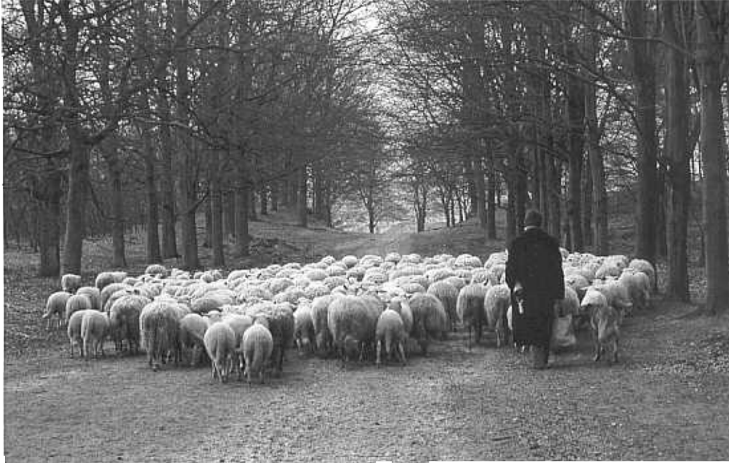
De schapendrift op Hooa Buurlo.

honderd jaar geleden uitzag. Zo had Nederland rond 1800 nog geen derde van het bosareaal van nu en het bos wat er was werd voornamelijk als hakhout geëxploiteerd. Grote kans dat de plek waar Van Lennep over de onafzienbare heide uitkeken, tijdens de grote ontginningen eind negentiende en begin twintigste eeuw is bebost.