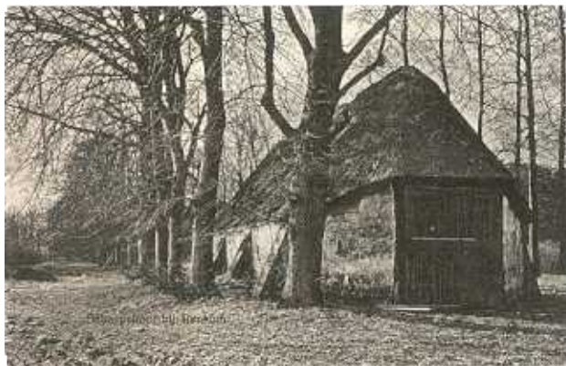
Deze schaapskooi bij Renkum is verdwenen, maar de beuken verklappen tot op de dag van vandaag de plek waar hij eens stond.