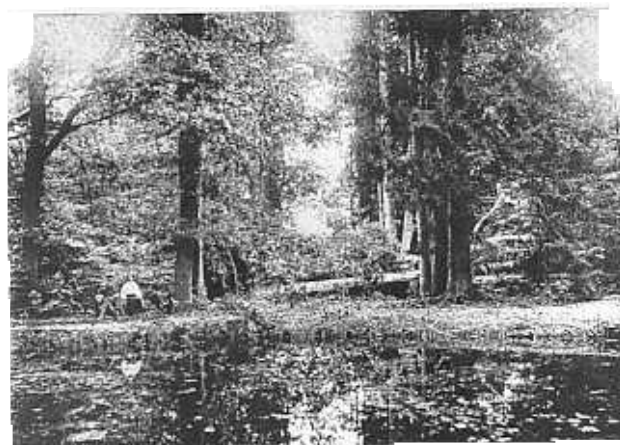
Stormschade in een monumentale laan op landgoed Den Treek in Leusden.

de belevingswaarde, niet alleen voor de bewoners zelf, maar het vergroot ook de aantrekkingskracht op bezoekers. Steeds vaker wordt hier door toeristische organisaties op ingespeeld met wandel- en fietsroutes waarin cultuurhistorie een belangrijke plaats inneemt. Cultuurhistorie is ook te combine-