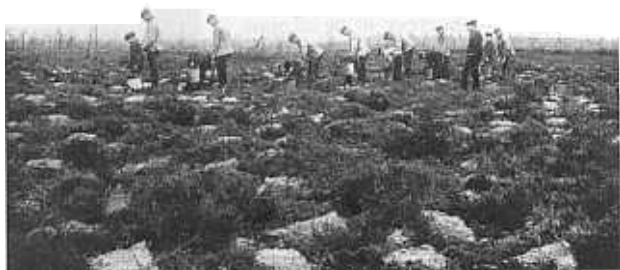
Tijdens de heideontginningen, einde negentiende, begin twintigste eeuw, zijn veel archeologische elementen verdwenen.