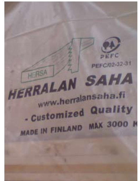
46% van het naaldhout is voorzien van een certificaat voor duurzaam bosbeheer

De discussie rondom illegale houtkap wordt met name gevoerd rondom tropische bossen. Daarom is de nadruk ten aanzien van de aantoonbare legale herkomst in deze studie op de productgroep gezaagd tropisch hardhout gelegd. Van het totale in 2008 in Nederland verbruikte volume gezaagd tropisch hardhout was 150.000 m 3 rhy (20%) voorzien van een