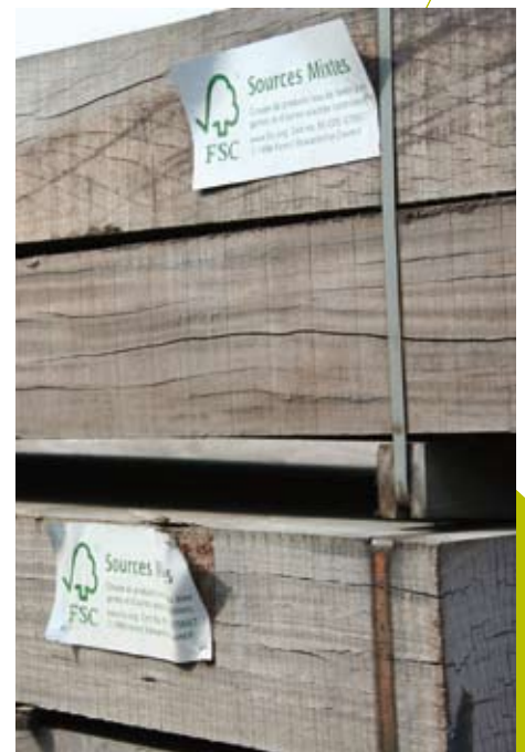
Het aandeel gecertificeerd tropisch hardhout is bijna verdubbeld t.o.v. 2005

Het rapport met alle resultaten is te downloaden via: www.probos.nl .