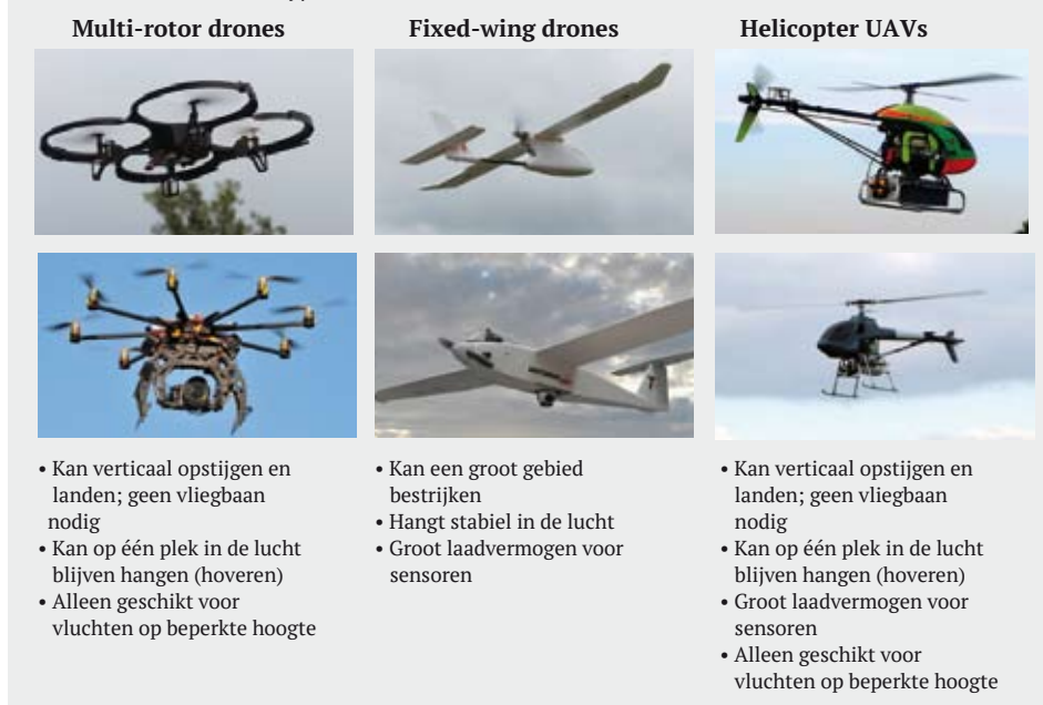
Tabel 1 Verschillende typen drones 2

Met een drone kunnen vanuit de lucht foto's of video's worden gemaakt die de bosbeheerder een nieuw perspectief op het bos bieden. De drone doet dan dienst als een extra paar ogen voor de bosbeheerder om bijvoorbeeld snel de staat van de wegen na een houtoogst te controleren, na te gaan hoeveel rondhoutstapels er nog in het bos liggen of te verkennen op welke plekken stormschade voorkomt.