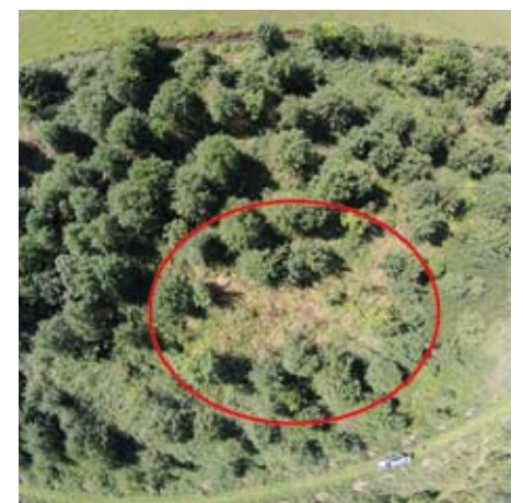
Figuur 2 Sterfteplekken veroorzaakt door essentaksterfte in een verruigd essenhakhoutperceel zijn vanuit de lucht eenvoudig te herkennen.

Het Engelse bedrijf BioCarbon Engineering gebruikt drones om grote gebieden te kunnen herplanten na ontbossing. De drones fotograferen het gebied waar de nieuwe bomen geplant moeten worden en verzamelen data over reliëf, vegetatie en bodemvochtigheid. Hiermee wordt een uitgebreide 3D-kaart van het terrein