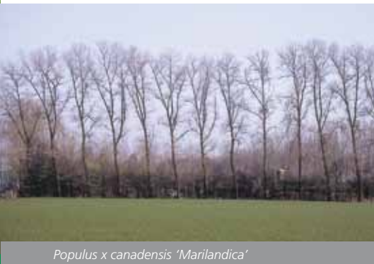
Populus x canadensis 'Marilandica'

Heeft de populier een toekomst in Nederland? "Je weet het nooit", klinkt nuchter. "Omdat je van tevoren nooit weet of een soort op de lange termijn goed blijft. Verschillende populierensoorten zijn nu nog immuun voor roestziekte. Maar dat kan over een paar jaar veranderen. Maar het belangrijkste is dat de prijs voor deze houtsoort omhoog gaat. Dat kan eigenlijk alleen indien er een industrie komt die groot afneemt. Maar je moet echt veel productie hebben wil je er een industrie op laten draaien en moet nogal wat boomstammetjes doorvoeren om een fineermachine aan de gang te houden. Want voor de openbare ruimte is hij niet geschikt en ook in het buitengebied worden liever boomsoorten aangeplant die langer sterk blijven dan dertig jaar."