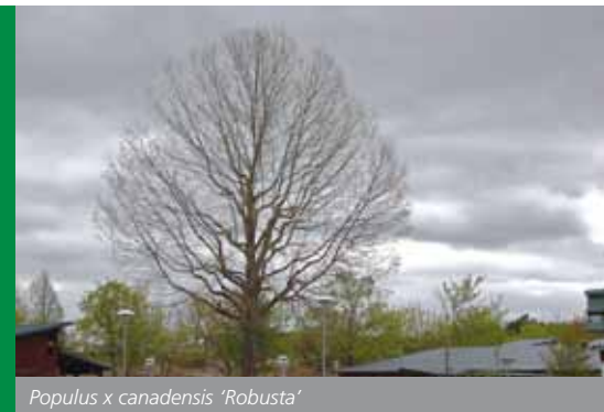
Populus x canadensis 'Robusta'