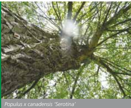
Populus x canadensis 'Serotina'