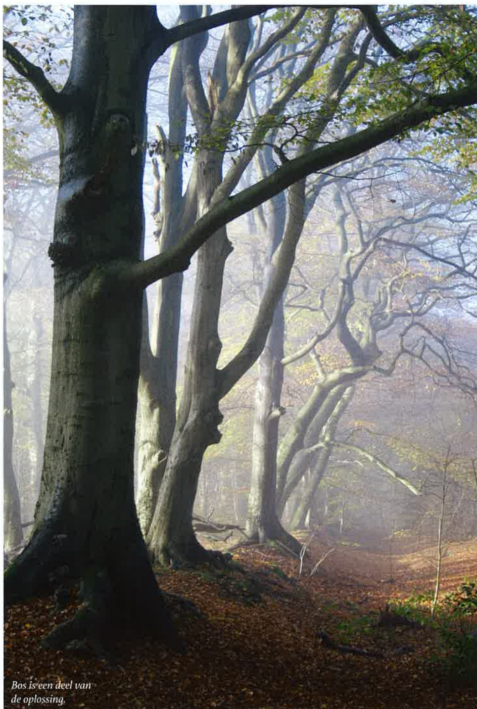
Bos is een deel van de oplossing.

"De stikstofbelasting moet zo snel mogelijk dalen tot niveaus die reeds in 1990 als maximum toelaatbaar zijn vastgesteld en we moeten onze bossen weerbaar maken tegen klimaatverandering. Bovendien liggen er volop kansen voor meer CO2-vastlegging in bestaand bos, bosuitbreiding en in het