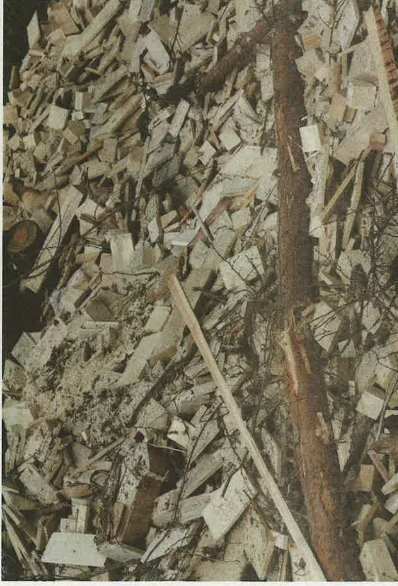
In 2022 is in totaal 1.224.000 ton houttieve biomassa in Nederland geoogst. 25 Procent daarvan is afkomstig uit bossen.

saccharales is gestegen in de periode 2017-2022 (+28 procent).