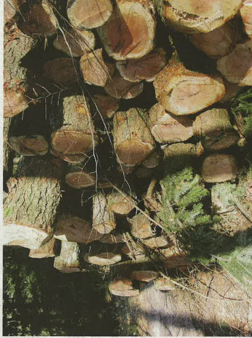
In 2022 is in totaal ongeveer 745.000 kubieke meter industrieel rondhout geoogst in het Nederlandse bos, waarvan 551.000 kubieke meter naaldhout en 194.000 kubieke meter loofhout.

biomassa is afkomstig uit de bebouwde omgeving (44 procent). De rest van de houttieve biomassa is afkomstig vanuit bossen (25 procent) en vanuit natuur en landschap (29 procent) waarbij de verhoudingen jaarlijks verschuiven, maar gemiddeld genomen stabiel blijft. Voor bos, natuur en landschap was de omvorming naar andere landgebruiksvormen of natuurtypen een zeer belangrijke reden van het vrijkomen van de houttieve biomassa. De afzet van houttieve biomassa is voor 2022 ingeschat op 1.268.000 ton. In 2021 werd 84,2 procent van de Nederlandse biomassa in Nederland afgezet en werd 15,4 procent geëxporteerd. In de periode 2017-2022 is de afzet van houttieve biomassa in Nederland geleidelijk gegroeid ten koste van de hoeveelheid geëxporteerde biomassa, als gevolg van een toename van energetische toepassing in Nederland. Het verbruik van houttieve biomassa in biomass-