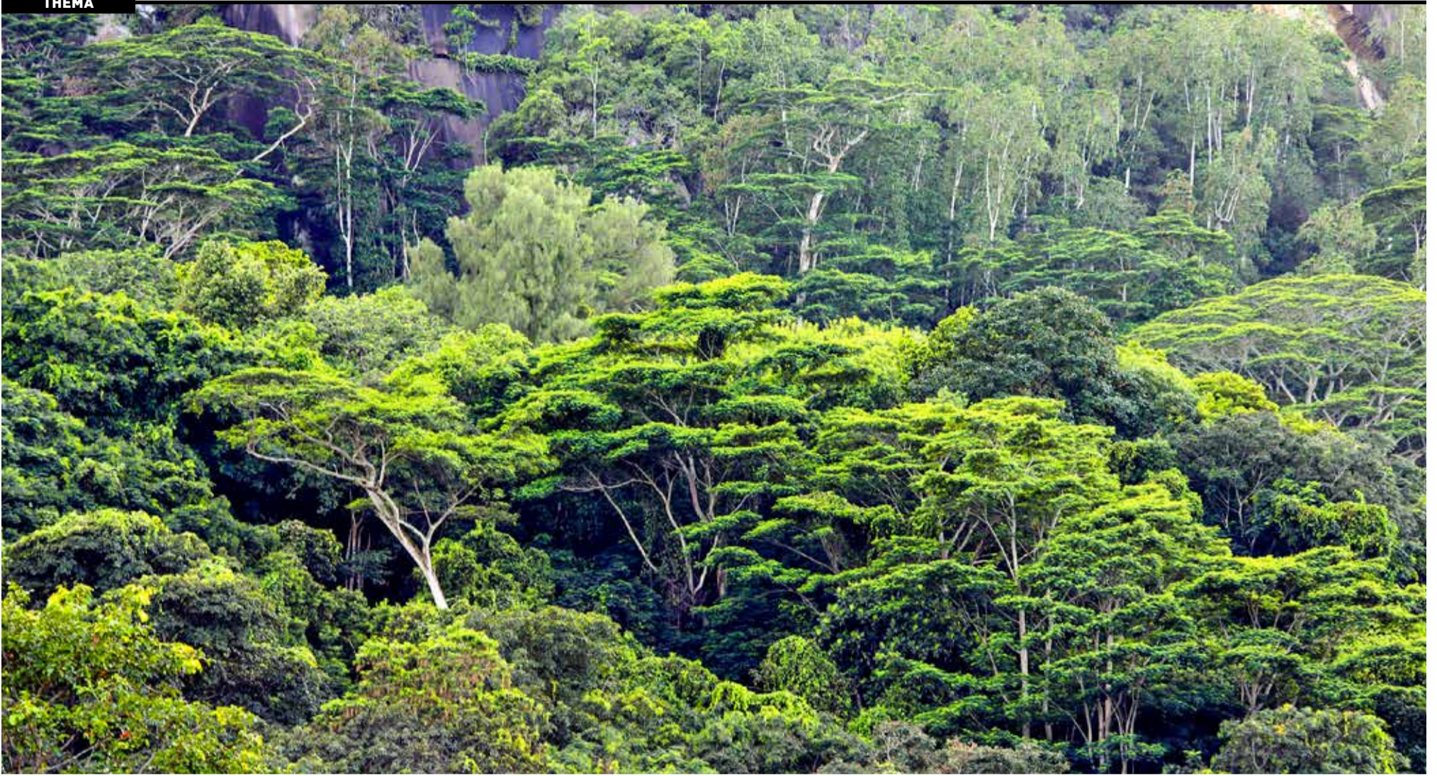
▲ Speerpunt van het Fair & Precious-programma is het Congo-bekken in Centraal Afrika.