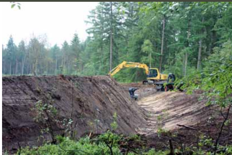
Ophogen van de wal en uitdiepen van de greppel.

Archeologisch veldonderzoek aan aarden wallen en greppels in bos- en natuurgebieden is tamelijk uniek. Daarom had dit onderzoek niet alleen tot doel om kennis te vergaren over de tien boswallen op de Veluwe, maar diende het onderzoek ook als pilot om te kijken of archeologisch veldonderzoek nieuwe kennis kan opleveren over wallen en greppels.