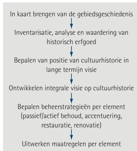
Figuur 2: Schematische weergave van het werken aan cultuurhistorie in het bosbeheer

Het is van groot belang om gebiedskennis vast te leggen voor toekomstige generaties (bosbeheerders). De gebiedskennis zit te vaak alleen in het hoofd van de huidige bosbeheerder, waarvan onherroepelijk te veel verloren gaat tijdens de overdracht naar een volgende beheerder. Het is verstandig om de gegevens zowel digitaal (GIS) als op kaart met bijbehorende beschrijvende rapporten en beeldmateriaal vast te leggen. Wanneer historische elementen verwerkt zijn in een GIS-systeem, kunnen zij (net als bij bijvoorbeeld horstbomen of dassenburchten) beter worden beschermd tegen beschadiging tijdens oogstwerkzaamheden. De aannemer kan dan in zijn harvester op zijn GPS zien waar zich waardevolle historische elementen bevinden.