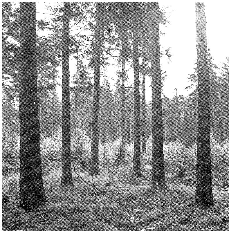
Staatsbossen op de Veluwe hebben een aanzienlijk aandeel in de Nederlandse houtoogst.

Het belangrijke doel van het systeem is, zoals het Bosbouwministerie van British Columbia stelde, „een krachtige, efficiënte en op wereldschaal goed concurrerende houtverwerkende industrie te stimuleren, het-