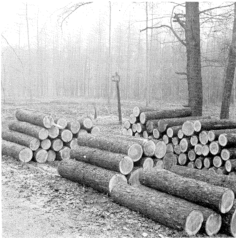
Staatsbos in Drente.

geen inhoudt dat prijzen worden vastgesteld die zorgen voor een rendement van het kapitaal, geïnvesteerd door efficiënte ondernemers, dat voldoende is om de „long term” instandhouding van een investeringsniveau in de industrie te verzekeren dat in overeenstemming is met het voor oogst beschikbare houtvolume”.