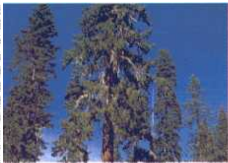
Boven: een exoot, de Douglasspar, afkomstig uit Oregon (VS). Onder: de inheemse grove den