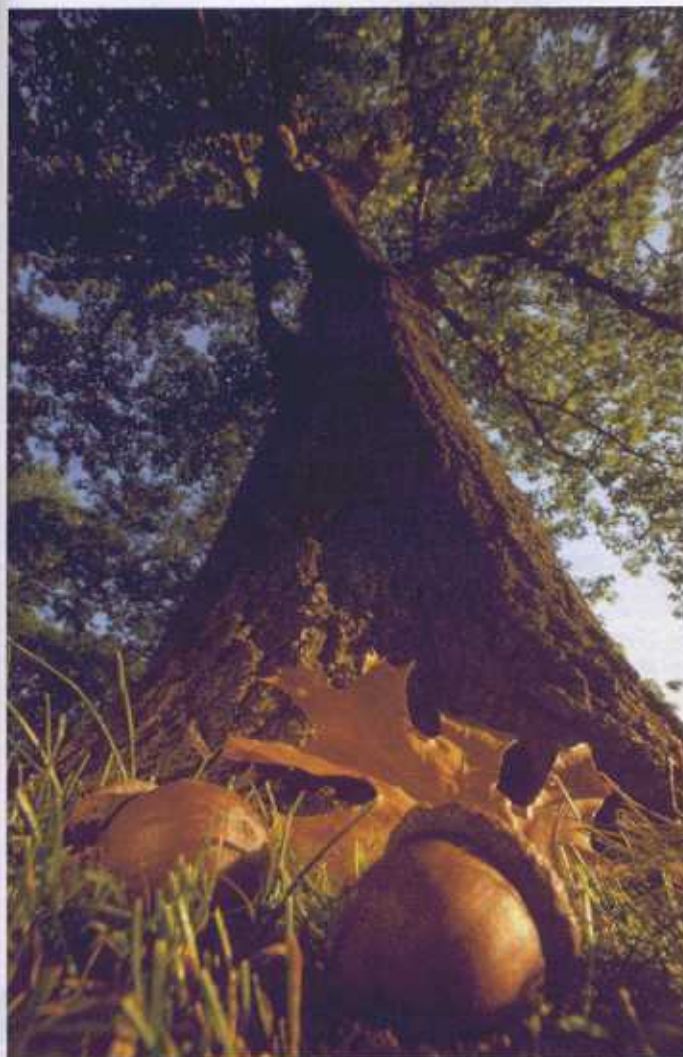
Hè bah, een allochtoon: de Amerikaanse eik