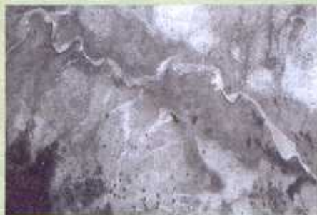
Steeds meer bomen (zwarte stippen) in Niger. Boven 2003, onder dezelfde plek in 1975

(4,5 procent in vijftien jaar). Ook een recente studie in het Amerikaanse tijdschrift Proceedings of the National Academy of Sciences (PNAS) wijst erop dat er niet alleen sprake is van massale ontbossing (in Brazilië en Indonesië), maar ook van een enorme toename van het aantal bomen en bossen elders in de wereld.